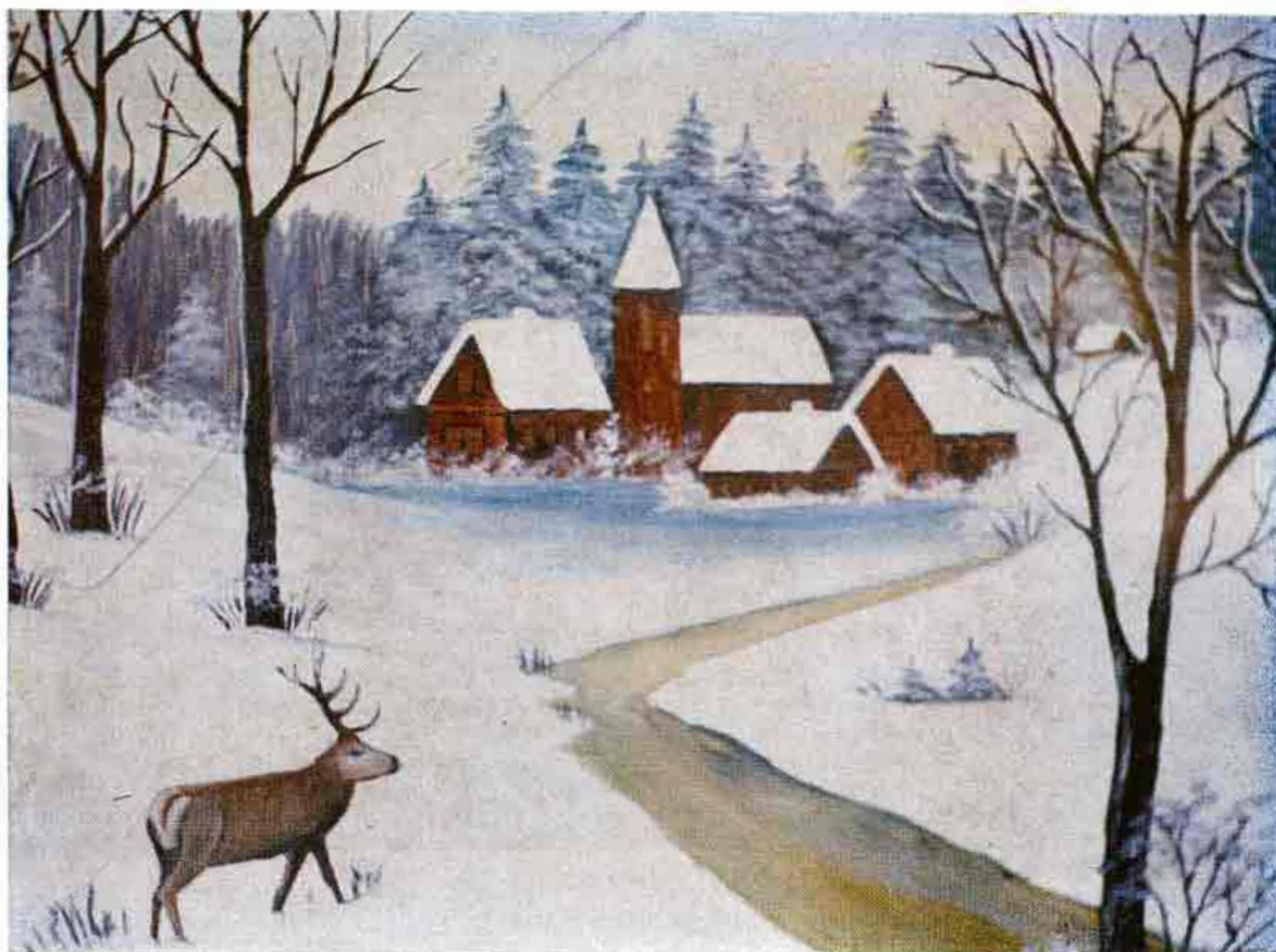
Nástenná maľba z podbránia domu. Unín, okr. Senica. Na obraze sa znova v centre námetu ocitá malebná dedinská osada. Kompozičným prvkom obrazu je kľukatá línia potoka, ktorá dotvára ilúziu priestoru. 1974