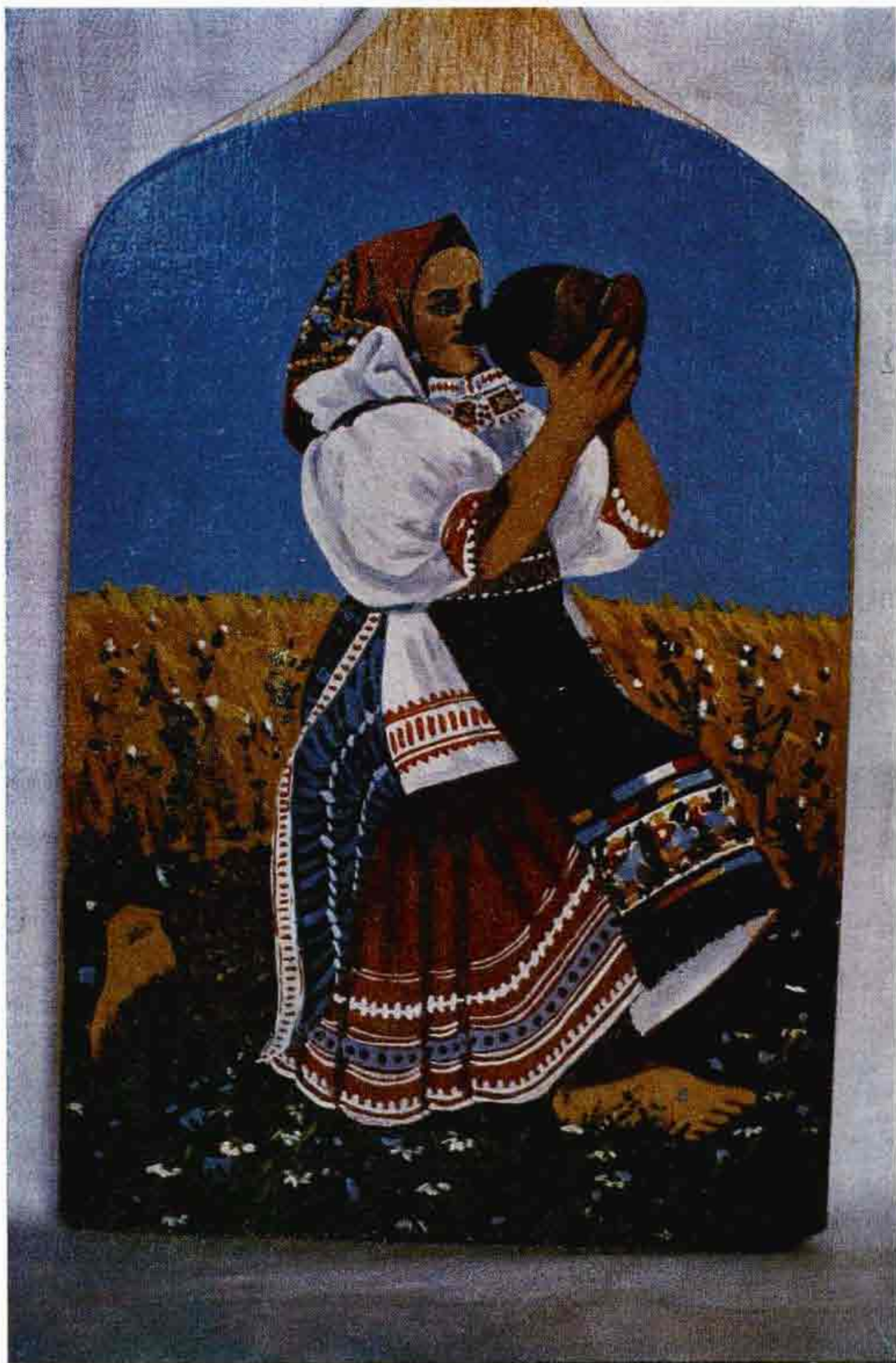
Michal Božoň: Kópia podľa obrazu J. Hálu. Važec. Estetický ideál tvorby Jana Hálu ako výsledok preniknutia jeho diela do vkusovej konvencie obyvateľov Važca sa objavuje v amatérskej maľbe miestnych výrobcov, ktorí zhotovujú kópie Hálových diel na plátne a dreve. Sú iba zdanlivo esteticky hodnotné, kolektív si ich vysleduje.