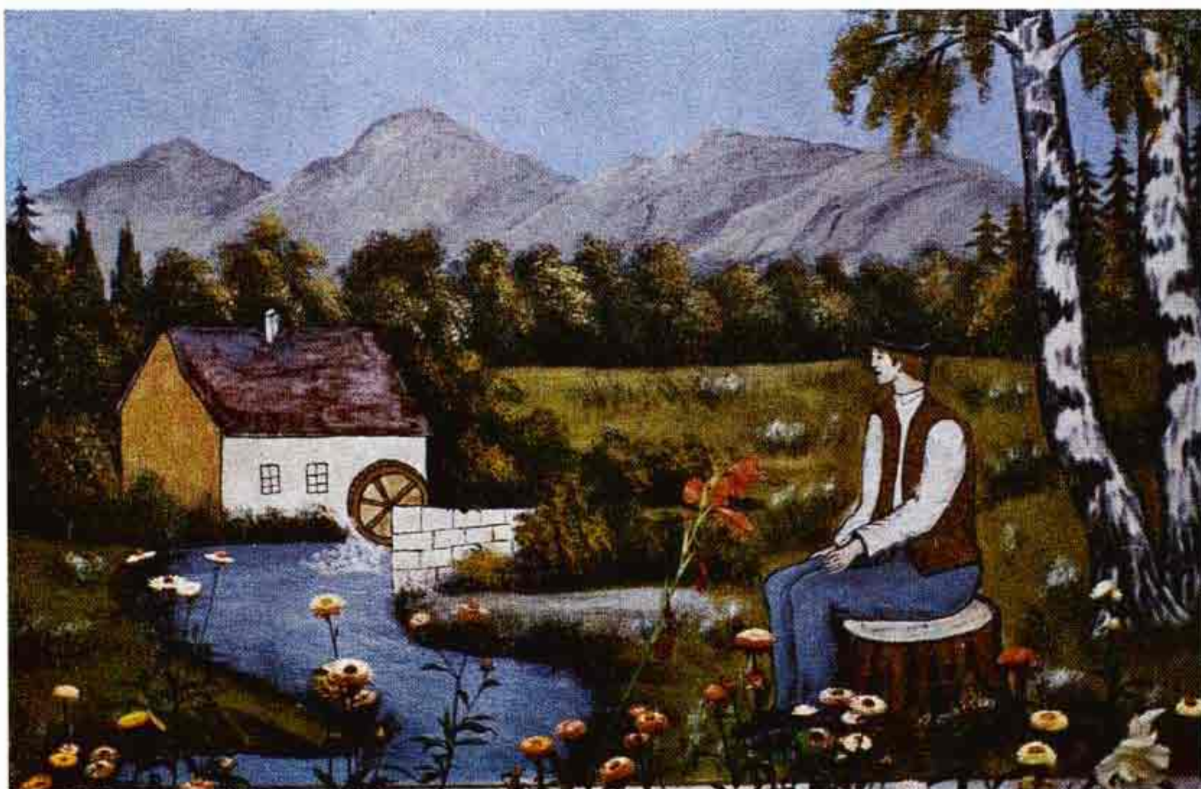
Nástenná maľba z podbránia domu. Maľoval F. Solarík r. 1972. Letničie, okr. Senica. Rozšírený motív vodného mlyna s dekoratívnymi mutáciami vegetácie, stromov, kvetov a pomerne zriedkavou figurálnou štafážou. Autor narába s predlohou voľnejšie, hravejšie, zreteľnejší je jeho príklon k naivnej polohe maľby. Foto O. Danglová 1974