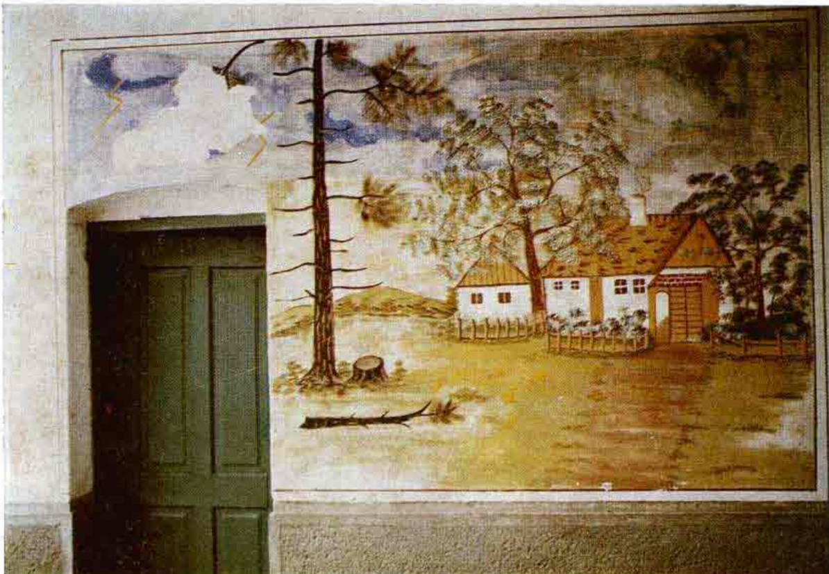
Umiestnenie nástennej maľby v podbráni domu. Láb, okr. Bratislava-vidiek. Maľovala H. Sirotová r. 1973.