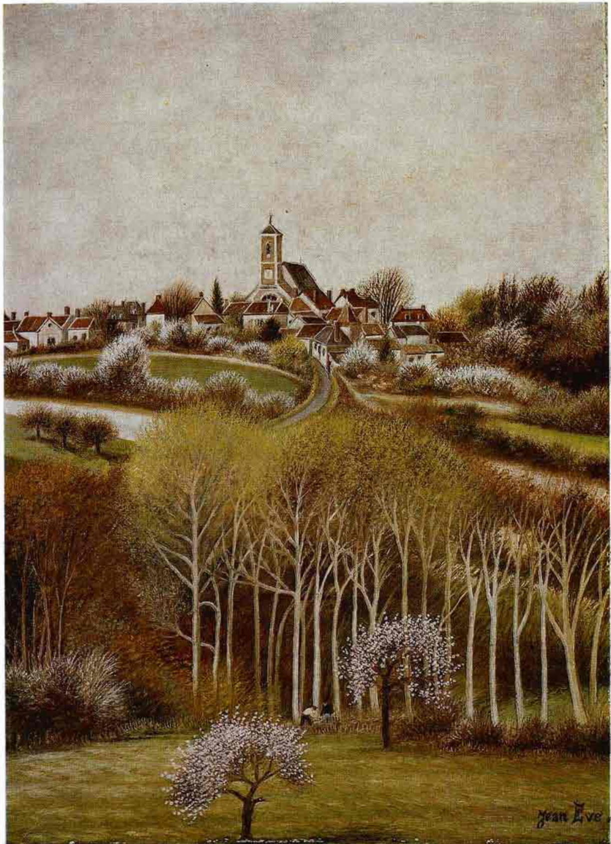
Jean Eve: Krajina. Olej, Francúzsko.