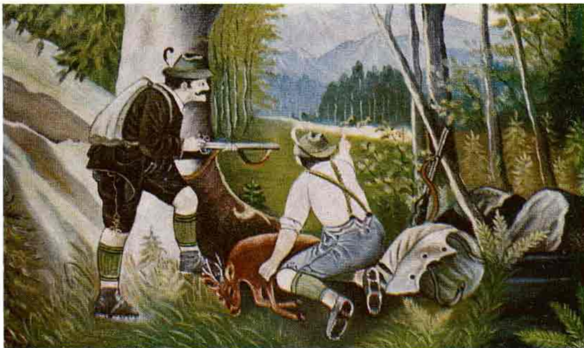
Nástenná maľba z podbránia domu. Radošovce, okr. Senica. Neznámy autor, maľba pochádza zo 60. rokov 20. stor. Obraz stvárňuje poľovnícky námet, inšpirovaný zrejme niektorou z početných litografických zobrazení loveckých. Foto O. Danglová 1974