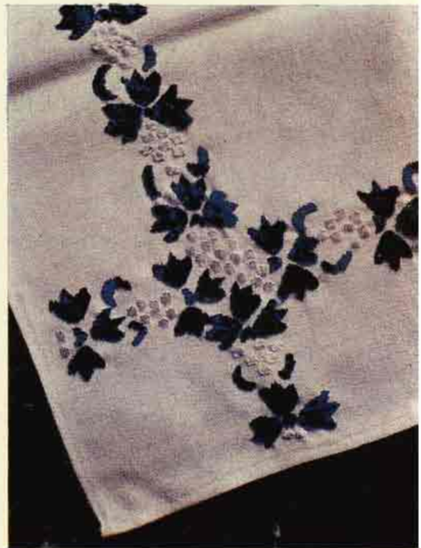
Súčasná tkaná a vyšivaná ornametálna výzdoba na obrusoch a obradových ručníkoch vo Važci, okr. Lipt. Mikuláš.